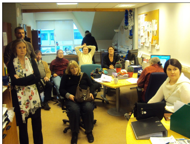
Frá deildarfundi í Skrifstofu-, atvinnu- og menntadeild Klúbbsins Geysis.

Bifreiðastöð Íslands BSÍ: (Tvö störf). Að halda umhverfi BSÍ hreinu og snyrtilegu, losa ruslastampa, létt gólfþrif í móttökusal og ýmislegt tilfallandi Vinnutími: 10:00 -14:00 aðra hverja viku.